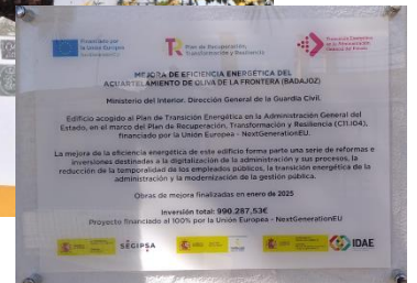
Fachada principal de la Casa Cuartel de la Guardia Civil de Oliva de la Frontera y detalle de la publicidad de financiación de la obra de rehabilitación