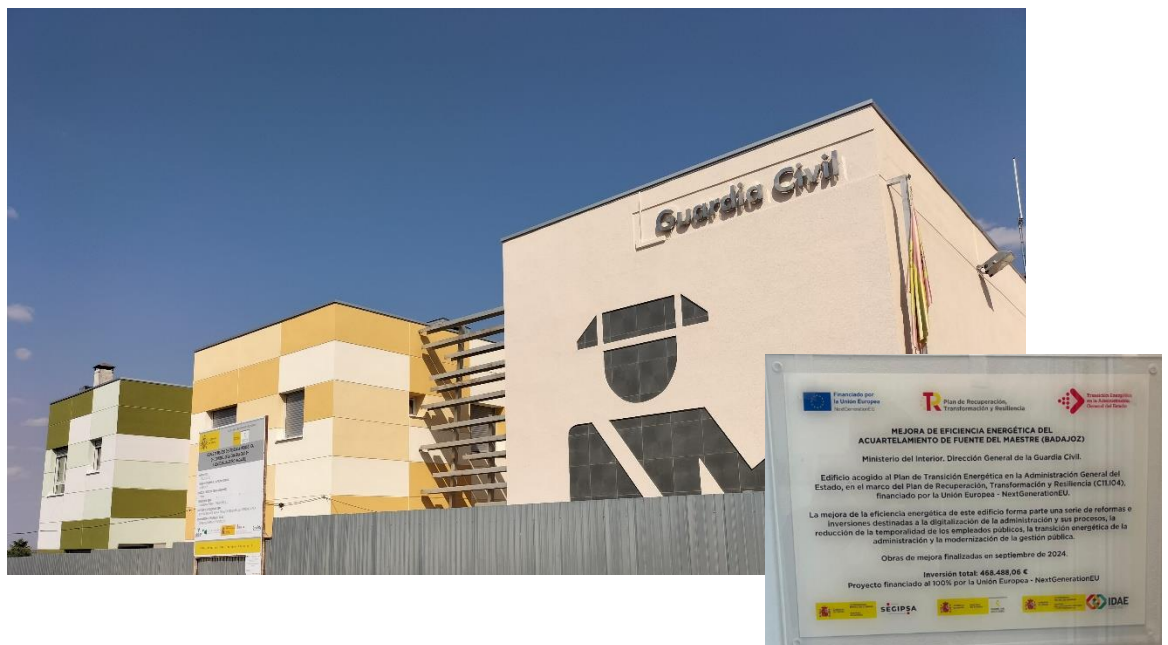
Fachada lateral del acuartelamiento de Fuente del Maestre y detalle de la publicidad de la financiación de la obra de rehabilitación

Se han cumplido los compromisos energéticos adquiridos en el Acuerdo interdepartamental y adendas posteriores entre la Secretaría de Estado de Energía y la Subsecretaría del Interior, renovándose energéticamente un total 2.233,12 m 2 de superficie, logrando al menos 1 salto de letra en certificación energética y un ahorro mínimo del 30% de energía primaria en sistemas afectados, para lo que se ha contado con un presupuesto de 2.448.165,37 €.